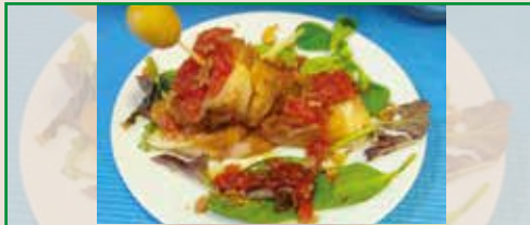
Tournedo de Pollo