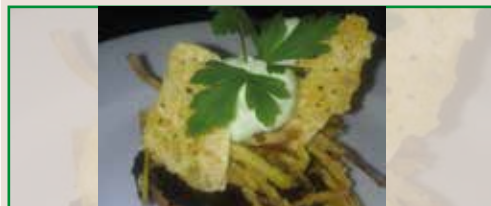
Crujiente de Burgos