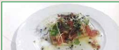
Micromezclum de navaja y gamba