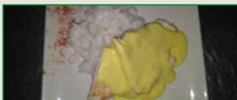
Pollo Taj Mahal