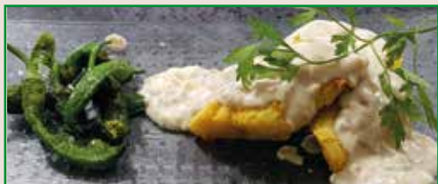
Bacalao con salsa de bechamel y cebolla caramelizada