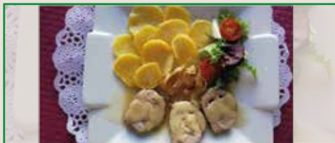
Solomillo al estilo Teide