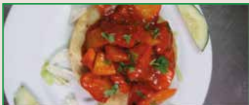
Mix Chat Puri