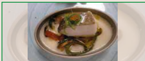
Bacalao confitado a mi manera