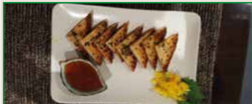
Pan Tostado de sesamo y Gambas