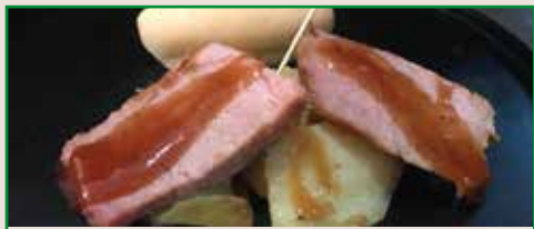
Solomillo al Oporto