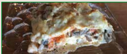
Lasaña de boletus